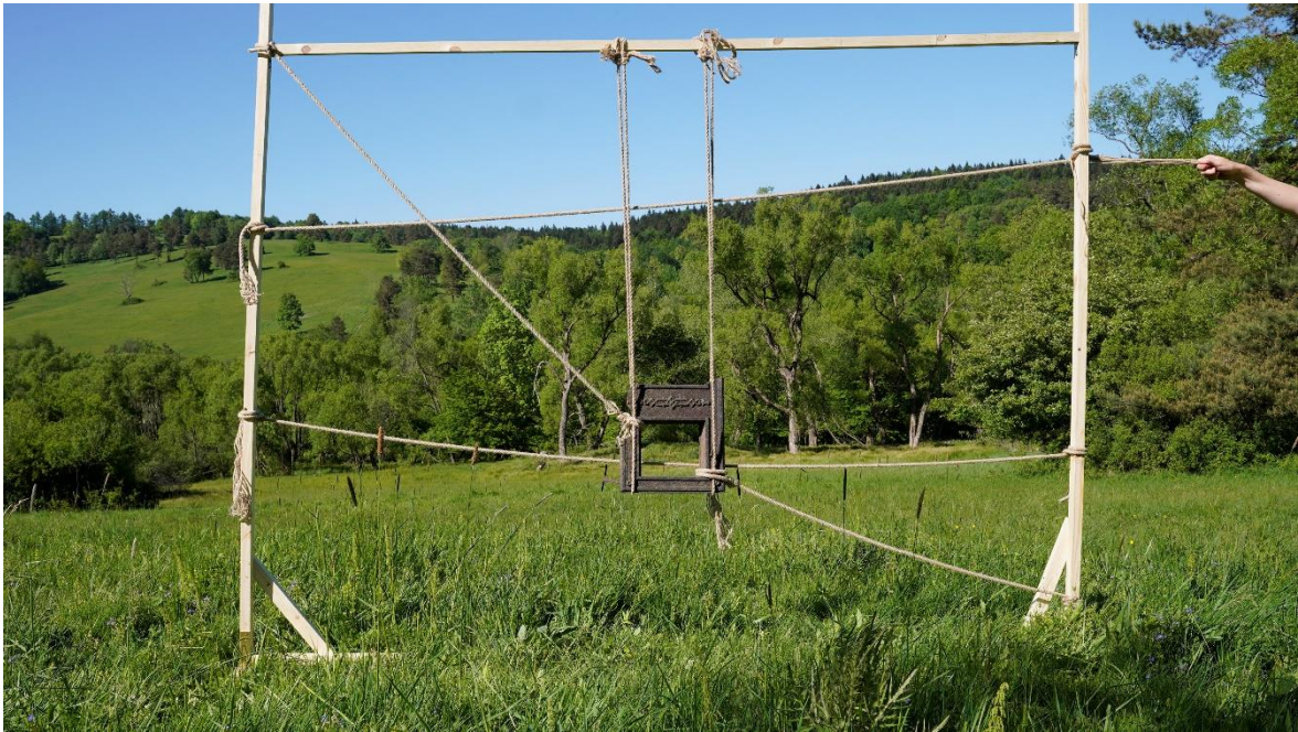
Kadrowanie krajobrazu. W miejscu, w którym wisi piec stała kiedyś chata. Obok widoczne są drzewa owocowe, oznaka dawnej obecności mieszkańców.