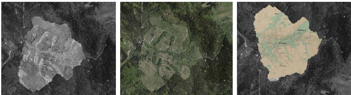
Zdjęcia satelitarne obszaru wsi Ropianka z zaznaczonym konturem lasu oraz naniesioną mapą katastralną z 1851.

Zapis miejsca zacząłem głównie od fotografowania. Zarejestrowałem również statyczne filmowe i dźwiękowe ujęcia Ropianki. W pewnym momencie zdałem sobie sprawę, że należy urzeczywistnić to fotograficzne studium krajobrazu w działaniu rzeźbiarskim. Wypełnić tzw. pustą kartkę. Zbudowałem drewnianą ramę o wymiarach 2,5 na 2 m i z jej pomocą, jeszcze w warunkach studyjnych, zacząłem kadrować i formować krajobraz doliny. Na rusztowaniu ramy instalowałem znalezione artefakty, próbowałem je ze sobą łączyć. Następnie, z tak skonstruowaną ramą, ruszyłem w teren, aby znaleźć w naturalnych warunkach odpowiednie miejsce i kadr.