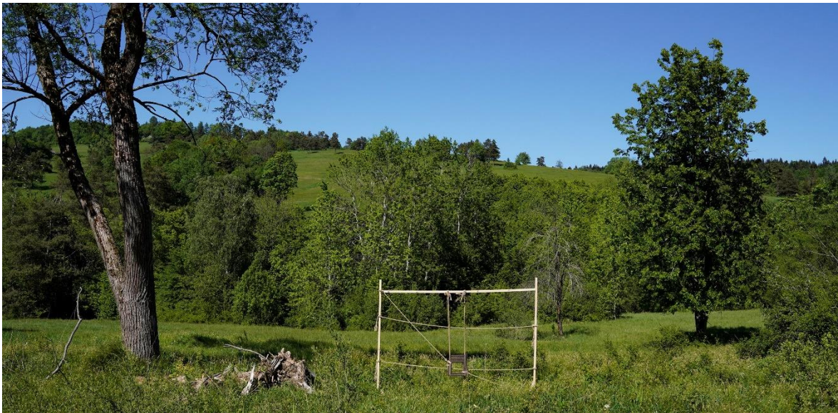
Kadrowanie krajobrazu. Rama stoi przy dawnej drodze, za nią w tle stała kiedyś chata.