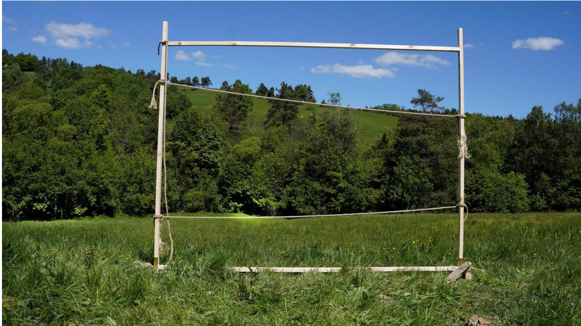
Kadrowanie krajobrazu. Wybrane miejsce do dalszych prac rzeźbiarskich.

Wybrałem miejsce oraz kadr dla kompozycji. Zapis tego działania nagrywałem aparatem ustawionym na statywie. Zanim przystąpiłem do pracy w większym formacie, stworzyłem mniejszy szkic, na którym zawiesiłem kamienie oraz inne roślinne artefakty, które znalazłem w Ropiance. Na podstawie tego mogłem ocenić pomysł. To działanie stało się punktem wyjściowym do pracy artystycznej.